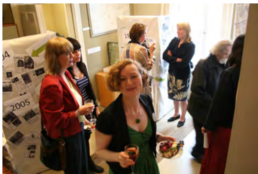
Bilder från institutets 20-årsjubileum.