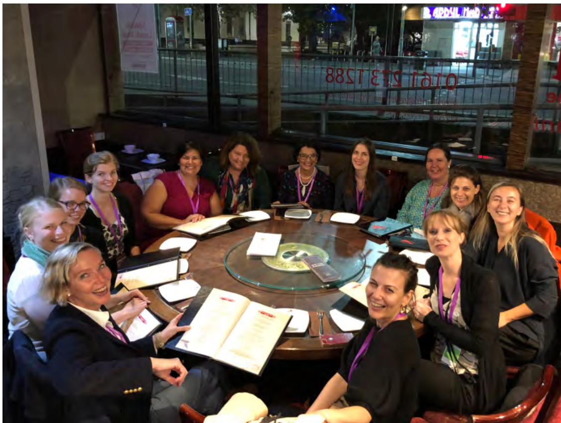
International lawyers in Manchester.