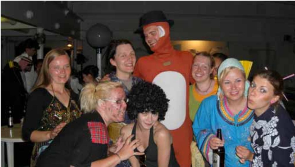
Den finska delegationen på maskerad....

Vi hade också maskerad två gånger, på avskedspartyt men också en gång före. Det handlade mest om att folk bytte folkdräkter med varandra för en kväll, men många var också väldigt kreativa i sina utstyrlar.