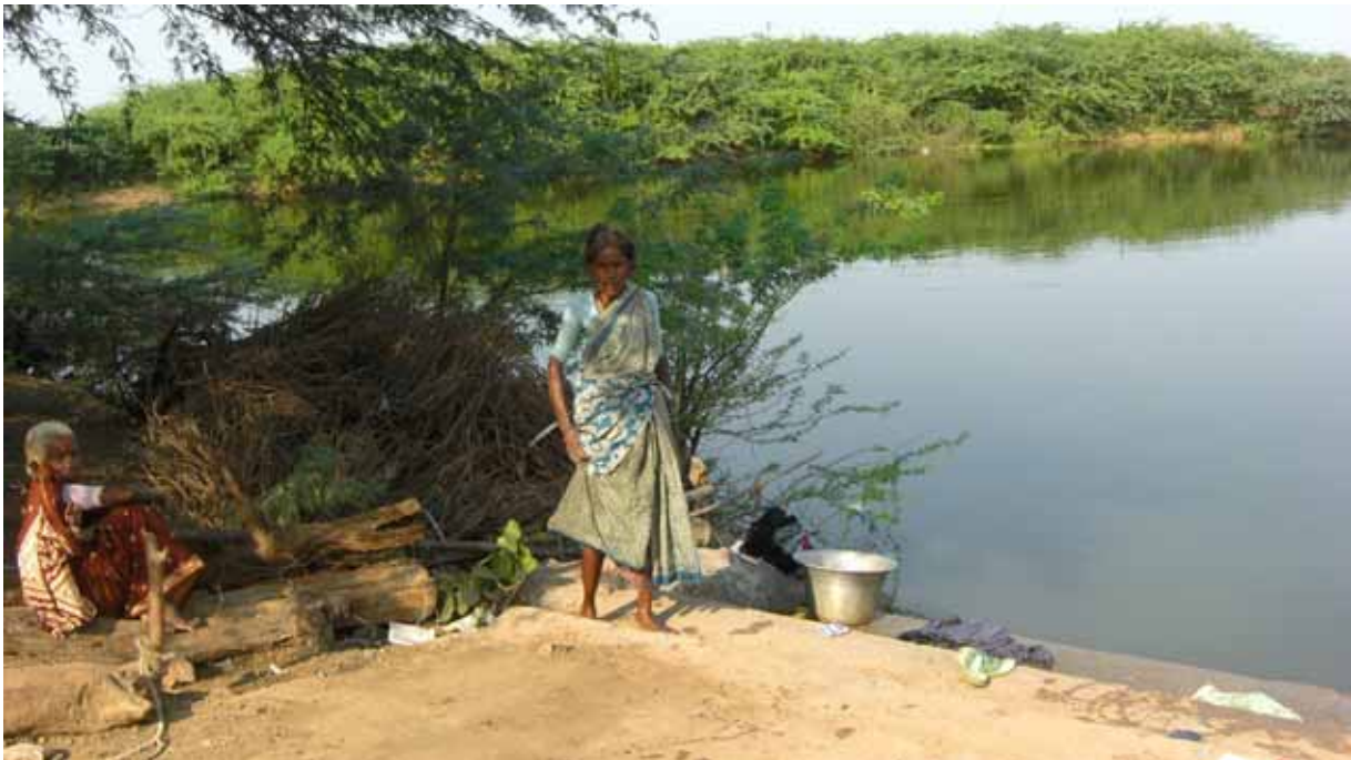
Kvinnorna tvättar kläder i Katrampakkam