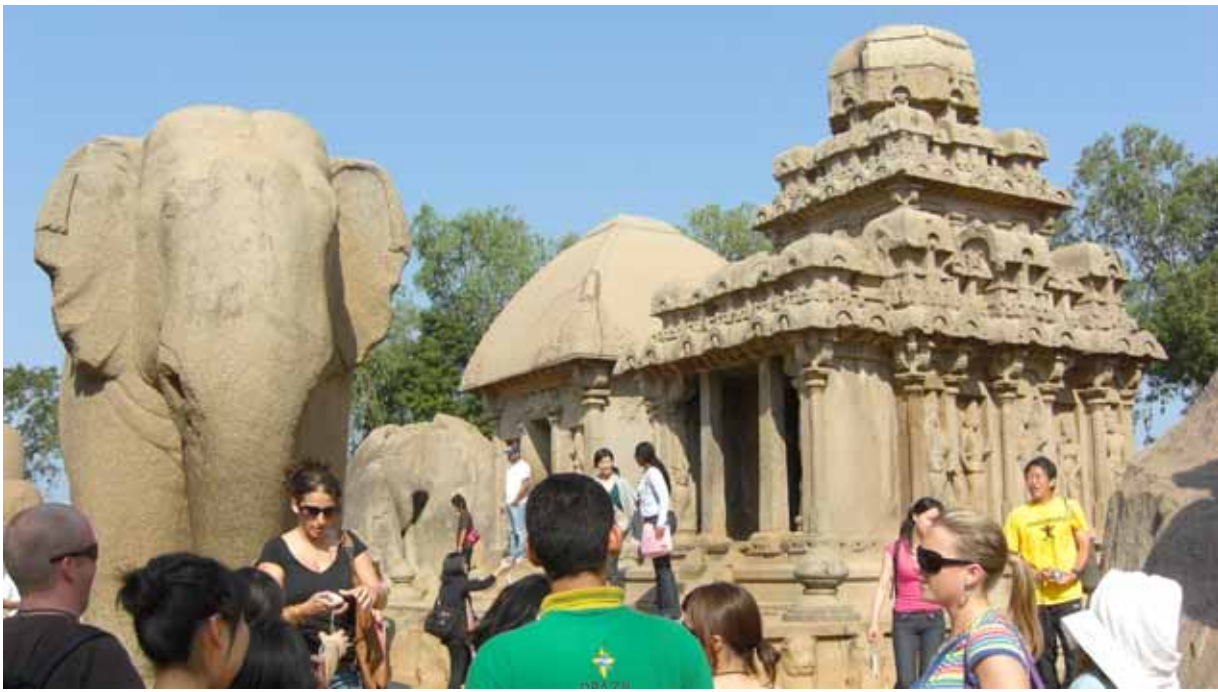
World Heritage: Mahabalipuram