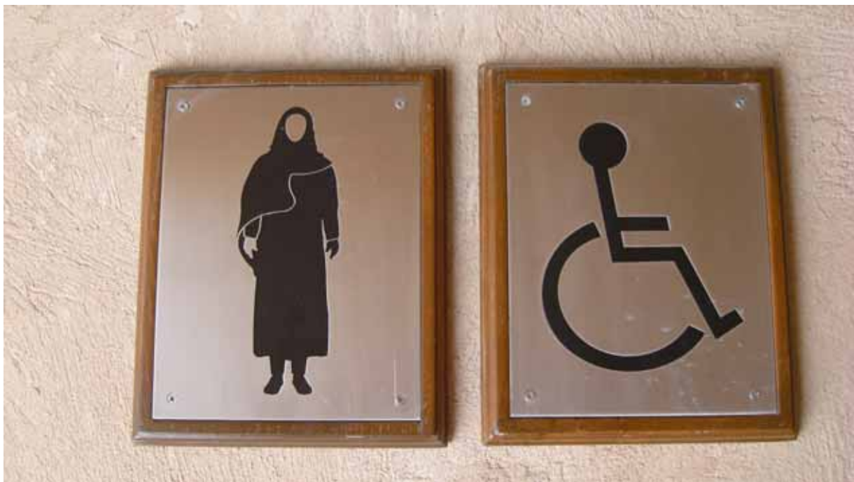
Kissnödig? Här är damernas!