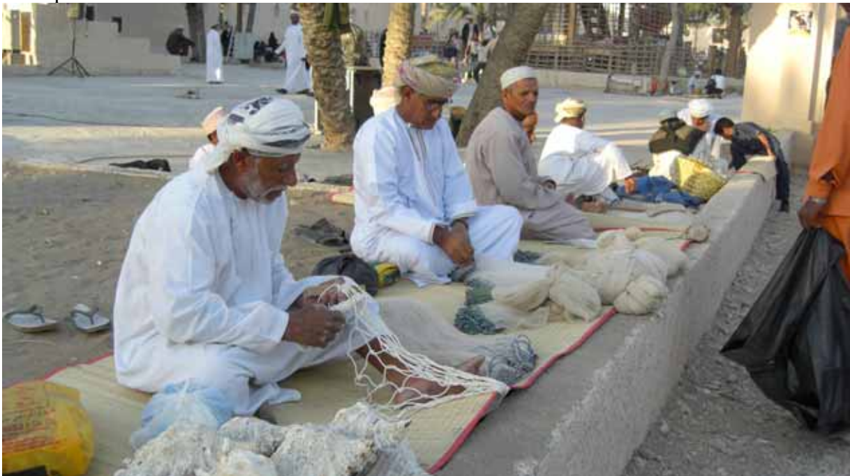
Huvudbonaden för män är även specifik för Oman. Här använder de inte den vanliga huvudbonaden vi är vana att se på arabiska mäns huvud.