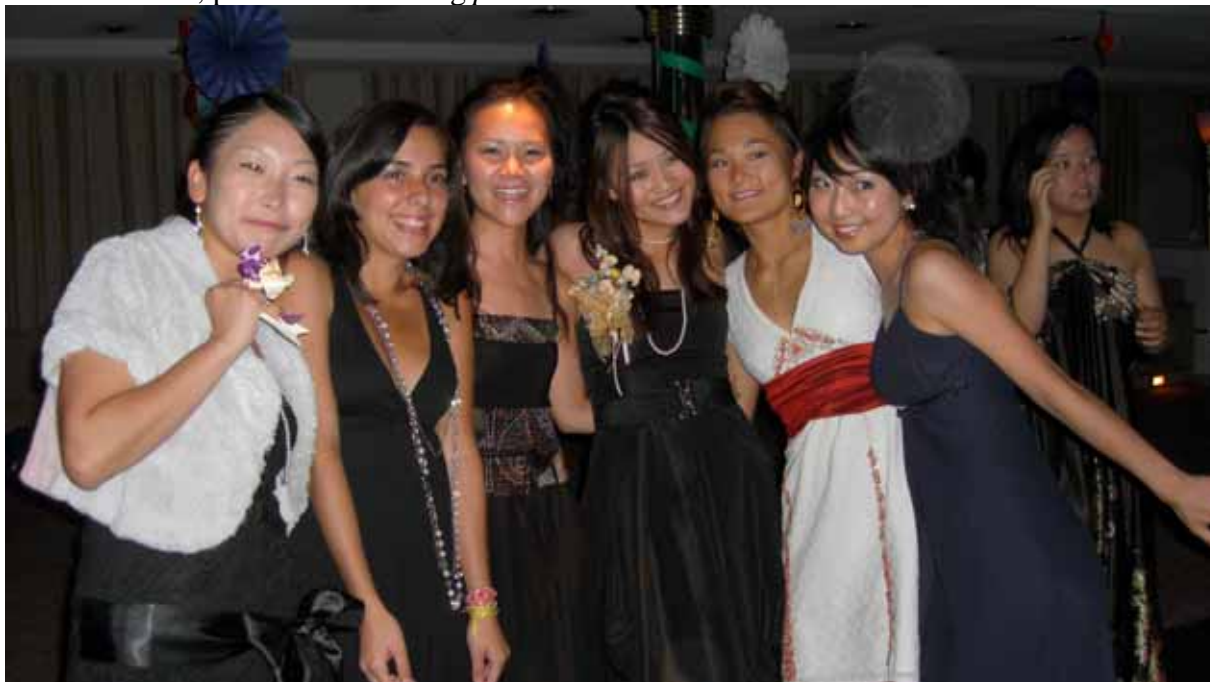
Vackra japanska damer, samt en från Costa Rica på American Prom Night

Den amerikanska festen hade temat High School Prom och var synnerligen en av höjdpunkterna under kryssningen. För det första hade det byggts upp en väldig nervositet ifråga om vem man skulle gå med. Problemet bestod i att vi var ungefär 2/3 tjejer på kryssningen och inte så många killar. Det löste sig med att många gick i kompisgrupp. För det andra blev balen uppskjuten en gång på grund av riktigt hårt väder då det inte passar att springa omkring i höga klackar och fina klänningen på grund av den häftigt gungande båten. Detta resulterade i att vi fick lov att gå på bal efter avskedsfesten, alltså den nästsista kvällen ombord. Många befarade att detta skulle resultera i tårar och allmän olust, men så skedde inte (tårarna kom istället i mängder sista dagen). Nej, denna kväll var ännu fylld av ett magiskt lyckoskimmer, mycket skönhet i form av klänningar, smink och frisyrer, mycket fotograferande men framför allt mycket skratt och dans. Det var en väldigt lyckad kväll, ett minne för livet, precis som en riktig prom .