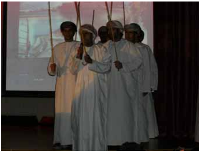
Den omska delegationen