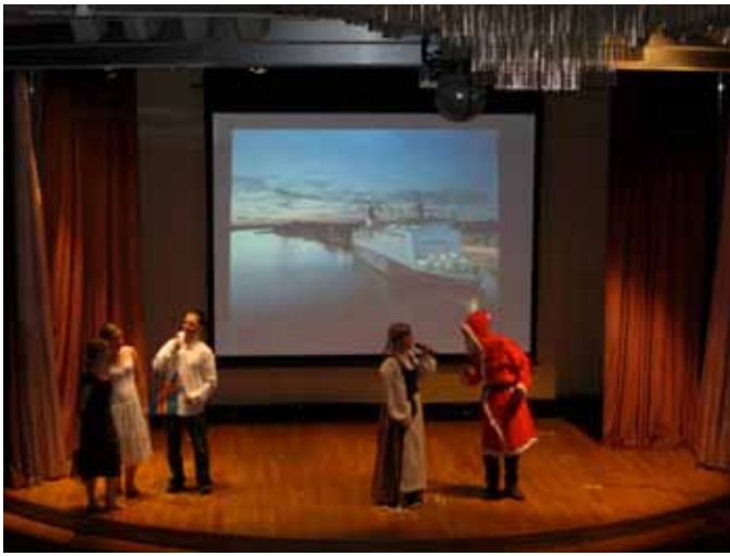
De tog bl.a. båten till Åland där det firades midsommar...