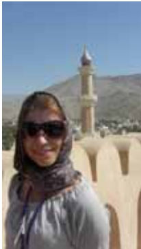
En omansk kvinna vid Niezwa fort...nej det är jag!