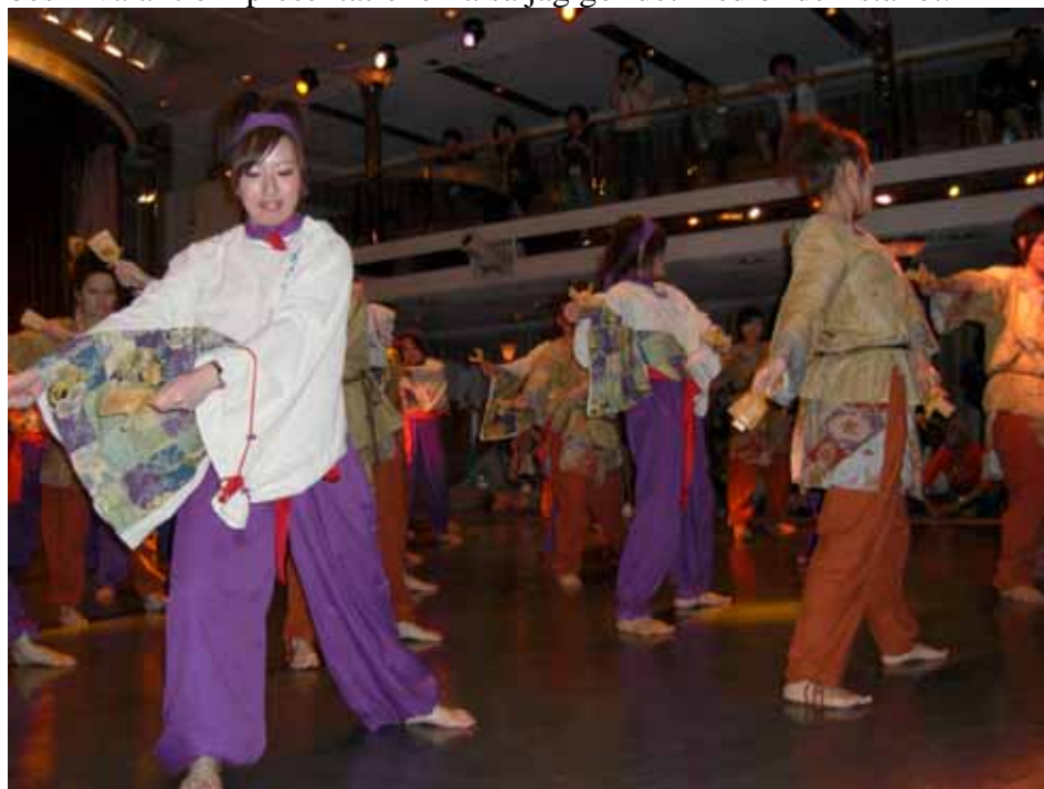
Japansk traditionell dans

På kvällarna var det oftast dags för de olika delegationerna att presentera sig och sitt land i tur och ordning. Presentationerna var mycket kreativa och bestod av många kulturyttringar såsom dans och sång. De presentationer som imponerade på mig var Japans, Costa Ricas, USA:s och Nya Zeelands. Dessa delegationer hade övat mycket och förberett sig väl. Det är svårt att beskriva allt om presentationerna så jag gör det med bilder istället.