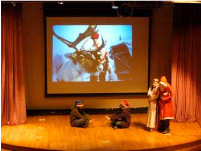
...och lyssnade till samiska historier i Lappland