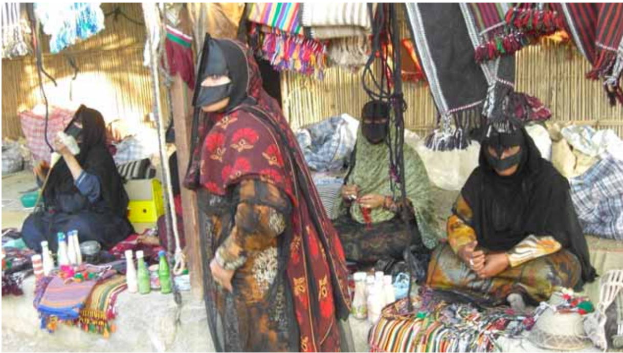
Den speciella omska kvinnomasken