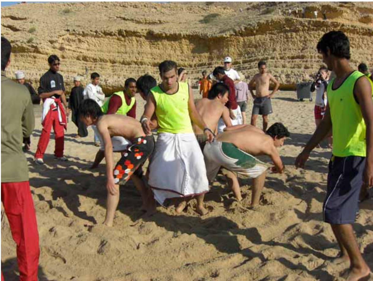
Interaktion med den lokala ungdomen (endast män) på stranden i Oman