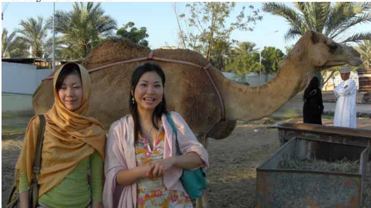
Kamelträff på Muskat festival, en festival som visade upp både den traditionella omanska kulturen men också den västerländska influensen i landet