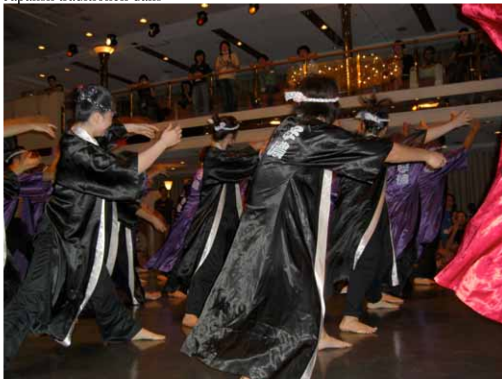
En annan japansk traditionell dans- mycket ansträngande