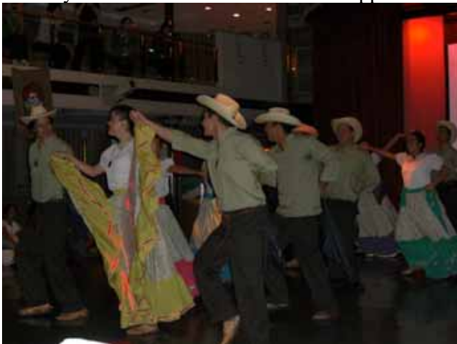
Costa Ricansk folkdans