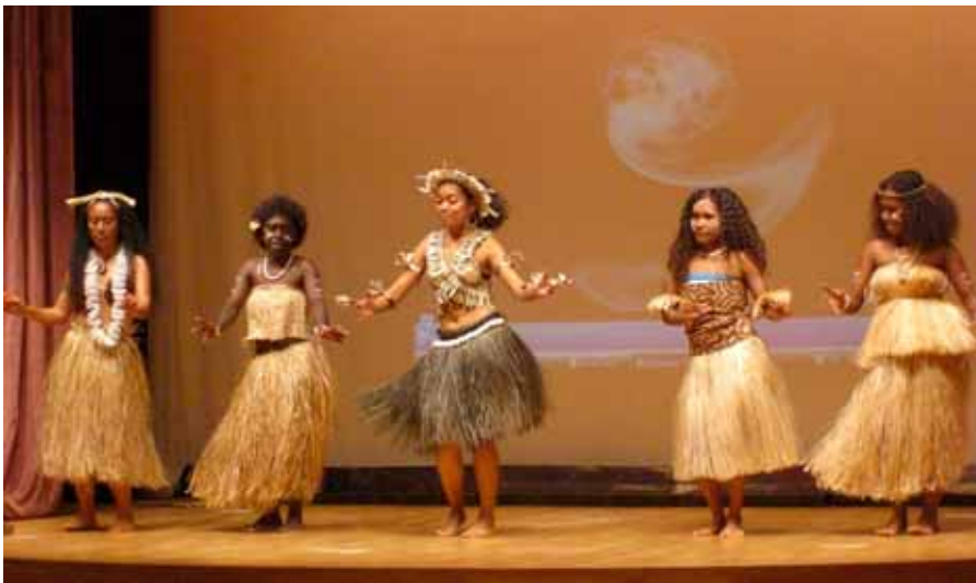
Solomon flickorna dansar