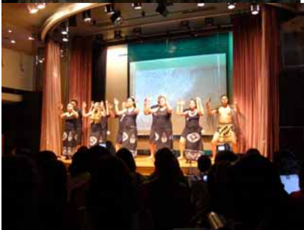
En maorikrigare och maoridans från Nya Zeeland