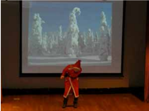
Den finska presentationen handlade om jultomten och Suomi neito som färdades genom Finland