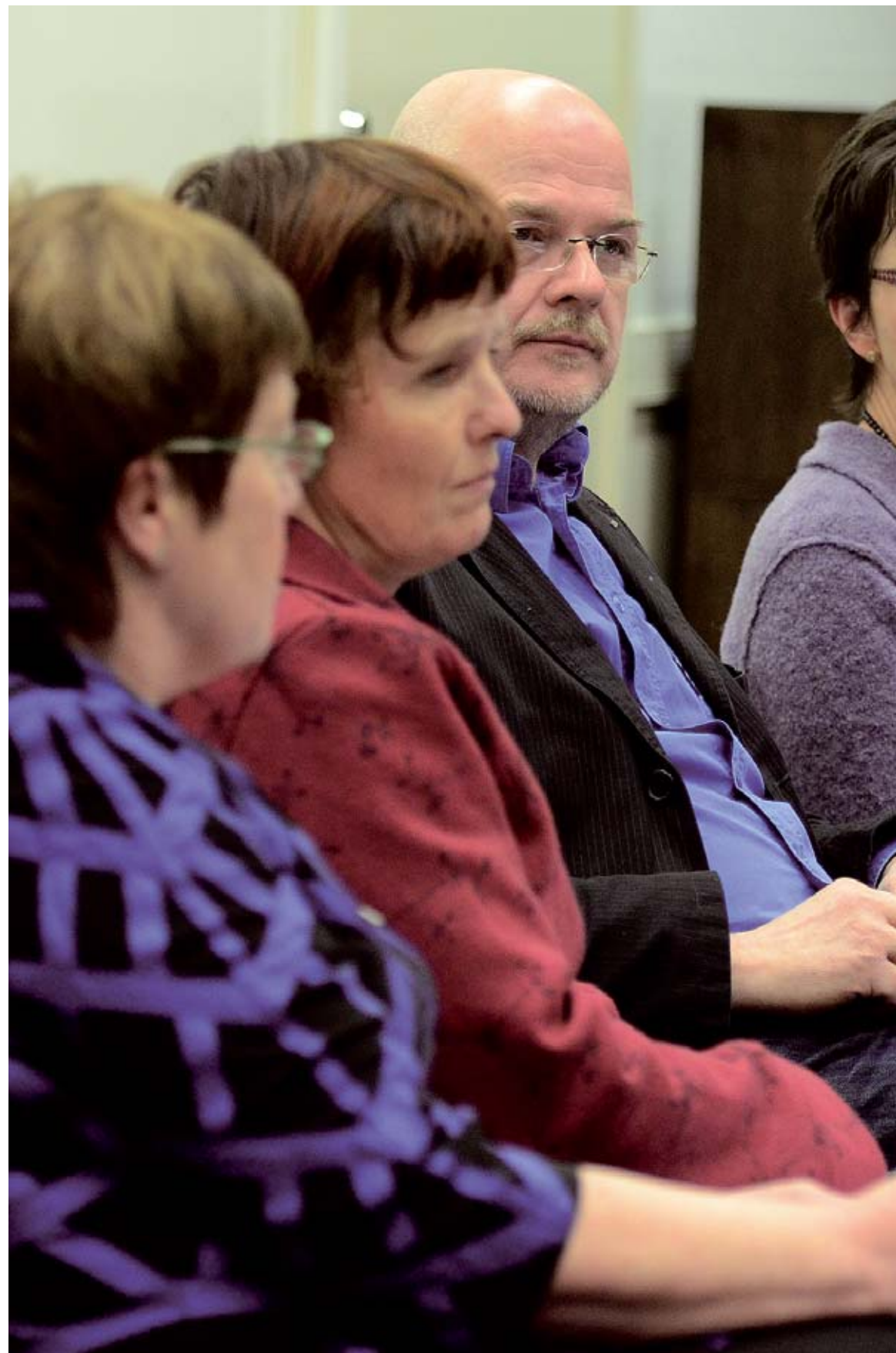
ENIG PANEL Utbildning, öppna diskussioner och satsningar på ungdomar är viktiga insatser mot sexbrott Nyholm.

Titte Törnroth-Sarkkinen titte.tornroth@nyan.ax