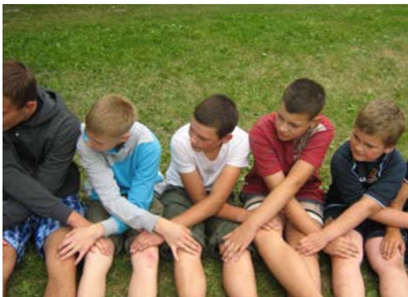
Killgrupp i Raguvele, Litauen/Boy Group in Raguvele, Litauen

The Girl and Boy Group Method is a method of work towards violence prevention and gender equality promotion with young people. The basis of the method is a democratic and non-hierarchical conversation between a small group of young people and their leaders.